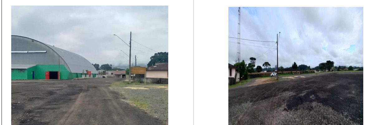
FOTO 5 - VIA DE ACESSO E ENTORNO FOTO 6 - VIA DE ACESSO E ENTORNO