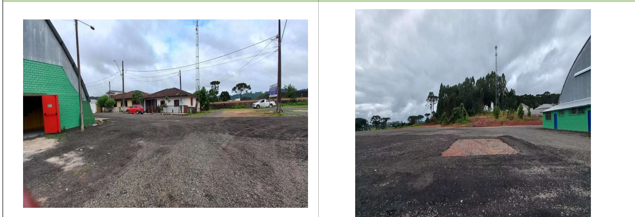
FOTO 3 - VISTA LATERAL ESQUERDA FOTO 4 - FUNDOS