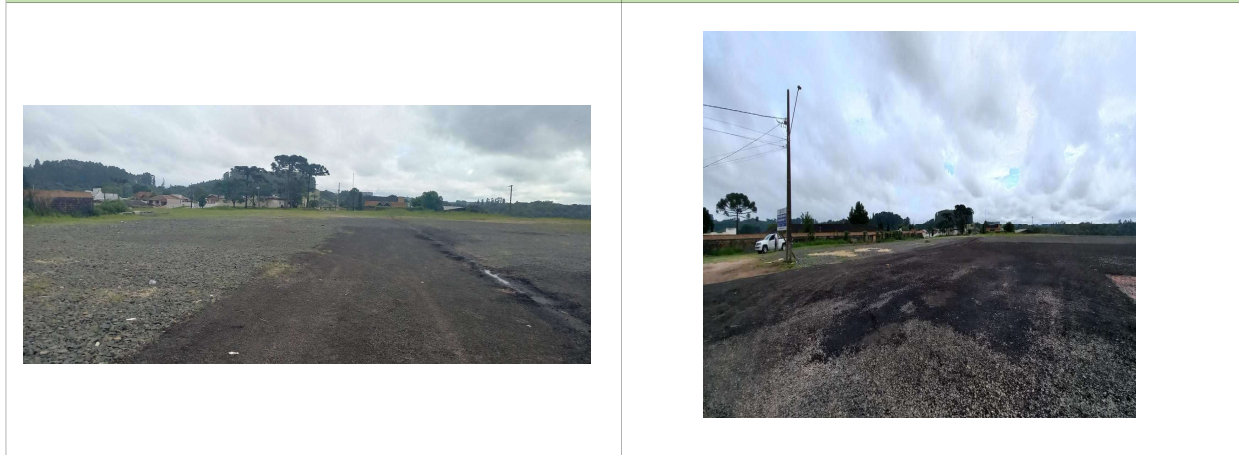
FOTO 9 - TERRENO FOTO 10 - ENTORNO