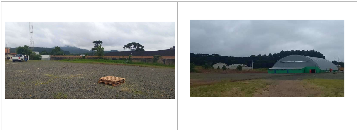
FOTO 13 - LOTE FOTO 14 - LOTE