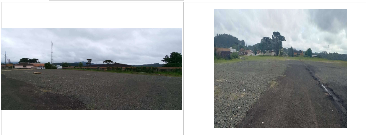
FOTO 7 - RUA LATERAL FOTO 8 - FRENTE

Município: PAULO FRONTIN Projeto: Meu Campinho