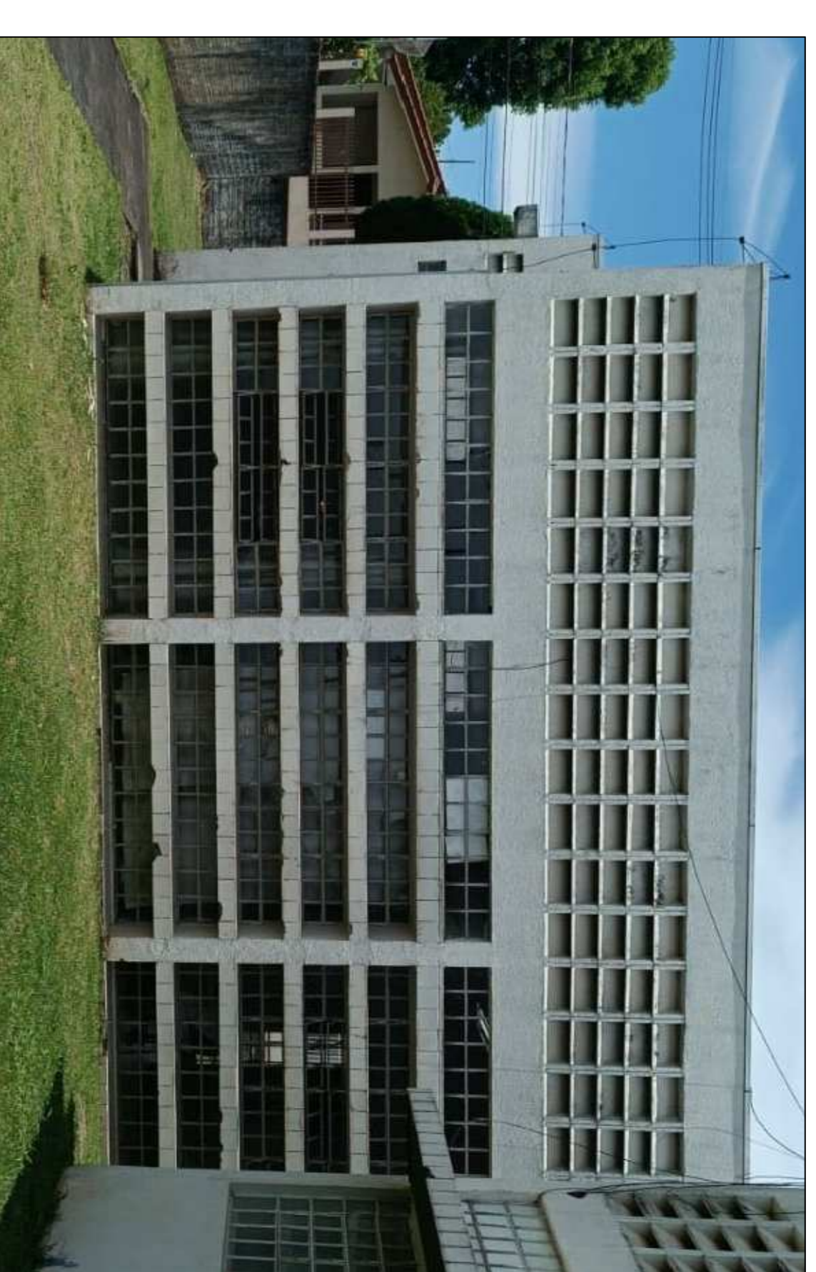
DETALHE 01 - DEMOLIÇÃO E CONSTRUÇÃO DO PEITORIL